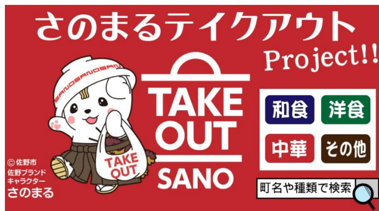
▲さのまるテイクアウトプロジェクトのイメージ画像

今後も当社は本プロジェクトを通じて、佐野市内飲食店の収益増、ひいては佐野市の活性化に取り組んでまいります。